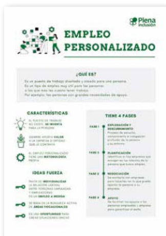
Empleo personalizado. Qué es, roles y fases