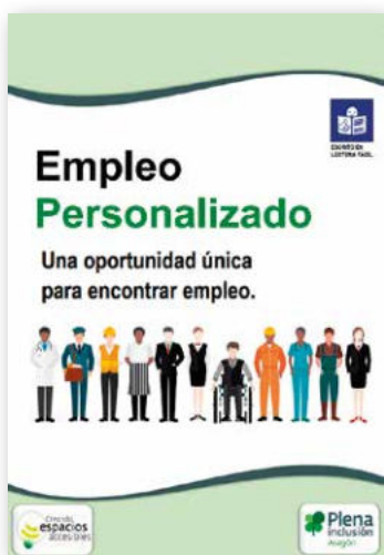
Empleo personalizado. Una oportunidad única para encontrar empleo. Lectura fácil