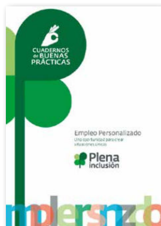
Empleo Personalizado. Una oportunidad para crear situaciones únicas