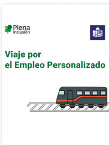
Viaje por el Empleo Personalizado