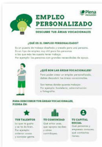
Empleo personalizado. Áreas vocacionales