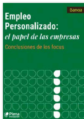
Empleo Personalizado. El papel de las empresas, conclusiones de los focus